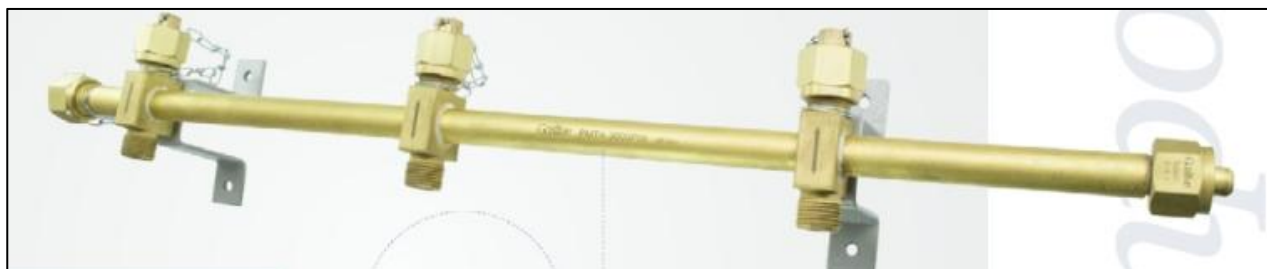
Figura 5 - Coletores

Referências: White Martins, Air liquide, Gaslive, Linde ou outro de qualidade similar ou superior.