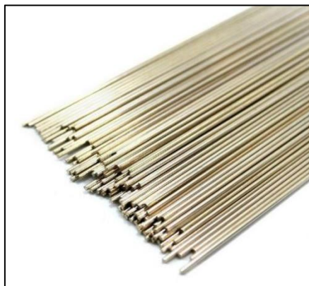
Figura 21 - Consumíveis de Soldagem