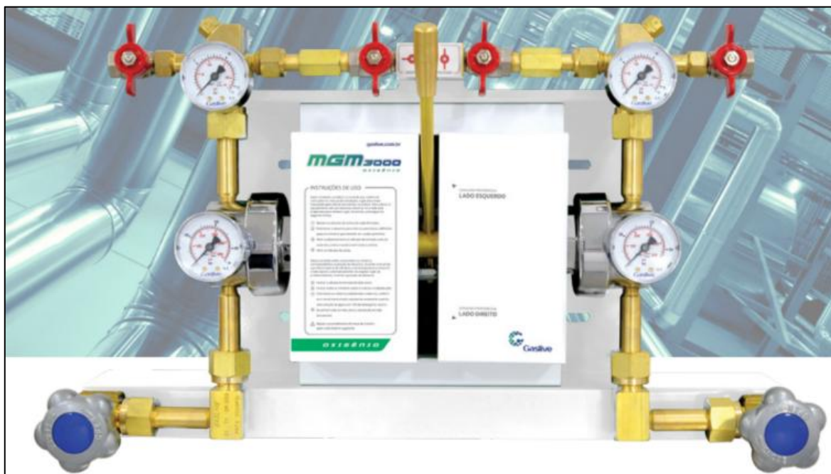
Figura 1 - Manifold de Troca Semi-Automática

Referências: White Martins, Air liquide, Linde ou outro de qualidade similar ou superior.