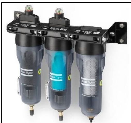
Figura 12 - Filtros de Partículas

Referências: Valmig, Atlas Copco ou outro de qualidade equivalente ou superior.