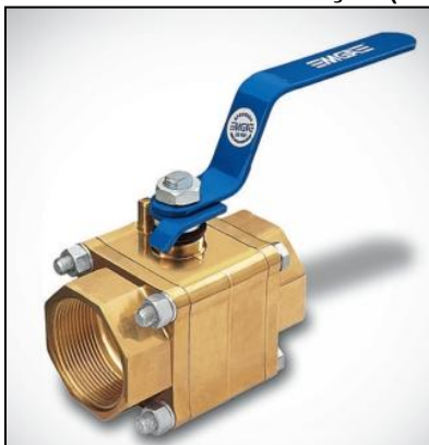
Figura 27 - Imagem ilustrativa de uma válvula de seção (válvula de bloqueio de esfera).

Referências: MGA Válvulas, Mipel ou outro de qualidade similar ou superior.