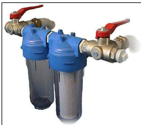
Figura 16 - Filtro Bacteriológico

Referências: Valmig, Atlas Copco ou outro de qualidade equivalente ou superior.