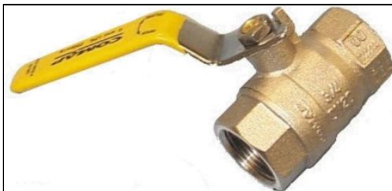
Figura 7 - Válvula de Bloqueio de Esfera

Referências: MGA Válvulas, Mipel ou outro de qualidade similar ou superior.