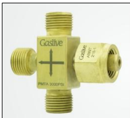
Figura 6 - Extensão de 3 Pontos

Referências: White Martins, Air liquide, Gaslive, Linde ou outro de qualidade similar ou superior.