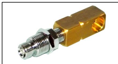
Figura 25 - Terminais de Consumo