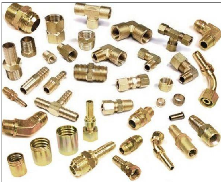
Figura 20- Conexões de Cobre e Ligas de Cobre