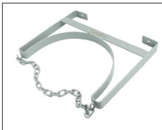
Figura 3 - Suporte para Cilindros

Referências: White Martins, Air liquide, Gaslive, Linde ou outro de qualidade similar ou superior.