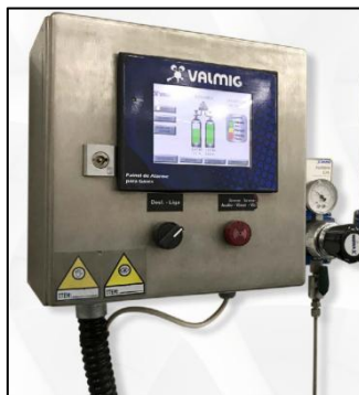
Figura 22 - PAINEL DE ALARME OPERACIONAL