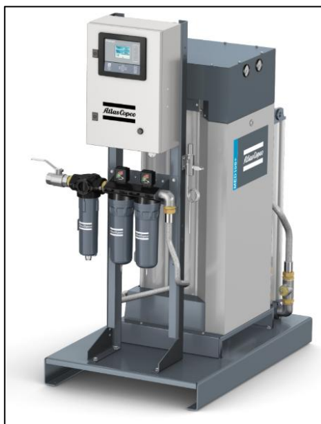
Figura 13 - Secador por Adsorção

Referências: Valmig, Atlas Copco ou outro de qualidade equivalente ou superior.