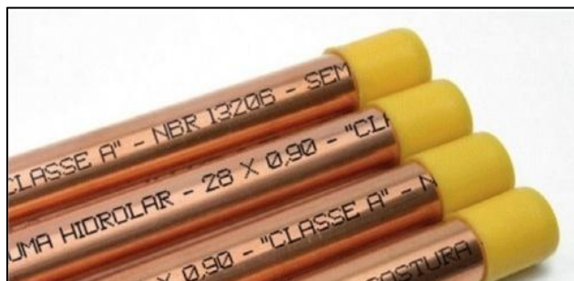
Figura 19 - Tubos de Cobre Classe A