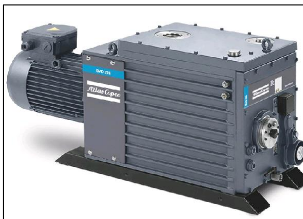
Figura 18 - Bomba de Vácuo

Referências: Valmig, Atlas Copco ou outro de qualidade equivalente ou superior.