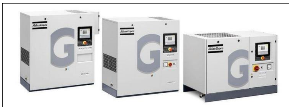
Figura 11 - Compressor de Ar

Referências: Valmig, Atlas Copco ou outro de qualidade equivalente ou superior.