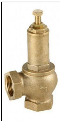
Figura 9 - Válvulas de Alívio de Pressão