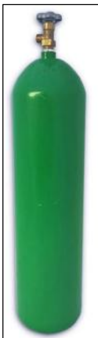
Figura 2 - Cilindros Alta Pressão

Referências: White Martins, Air liquide, Linde ou outro de qualidade similar ou superior.