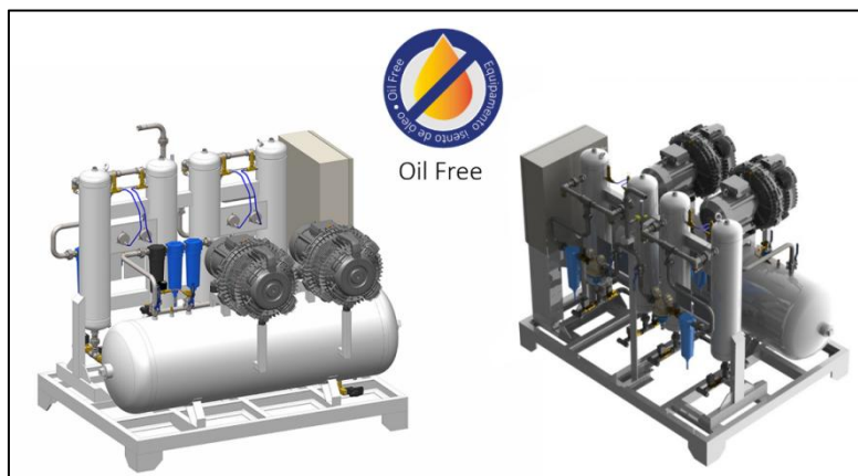
Figura 10 - Sistema de Ar Comprimido Medicinal