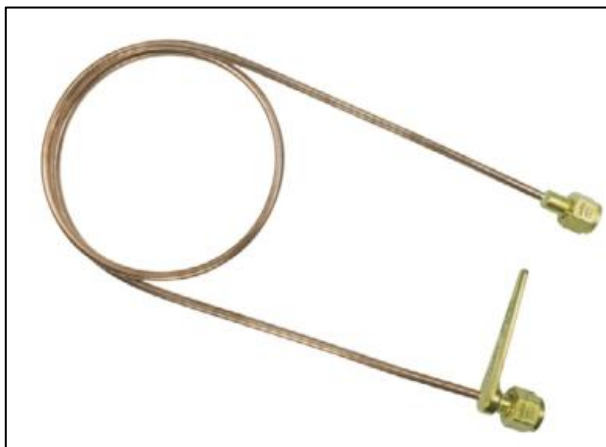
Figura 4 - Mangueira/Chicote Flexível