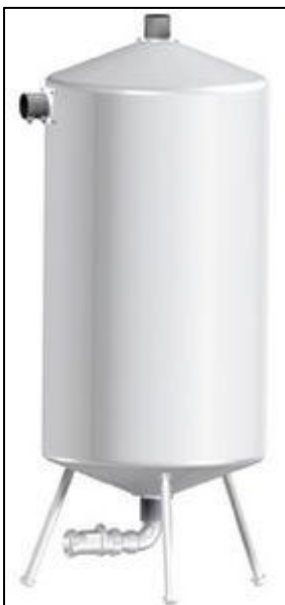
Figura 17 - Reservatório de Vácuo

Referências: Valmig, Schulz, Atlas Copco ou outro de qualidade equivalente ou superior.