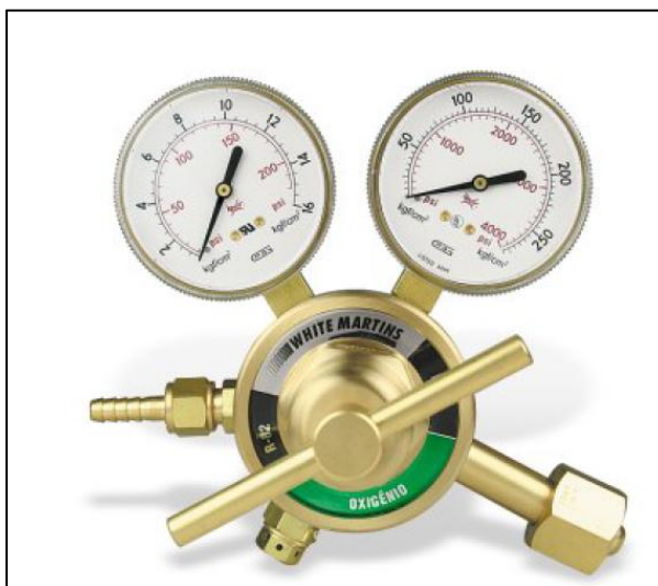
Figura 8 - Válvula Reguladora de Pressão