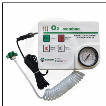
Figura 24 – Legenda do painel de alarme de emergência indicado em projeto