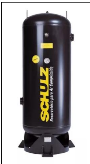
Figura 14 - Reservatório de Ar Comprimido